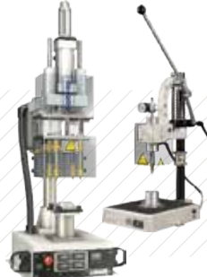
인서트 조립 장비