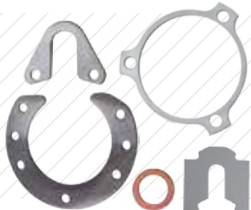
정밀 심 (Shims) 및 얇은 금속 스템핑