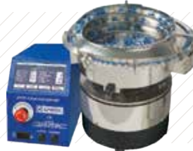
진동 공금 시스템