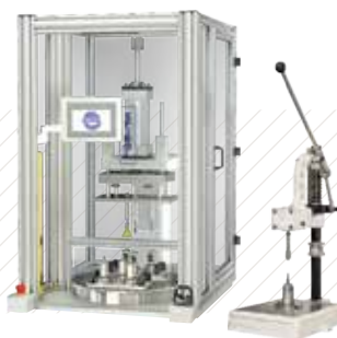
컴프레션 리미터 조립 장비

현재 기존사양 및 표준 규격제안 관련 www.SPIROL.kr 으로 방문하셔서 참조해주세요.