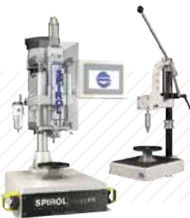
핀 조립 장비