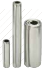
코일 스프링 핀