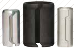
정밀 다월 / 부싱