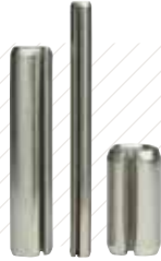
슬롯 스프링 핀