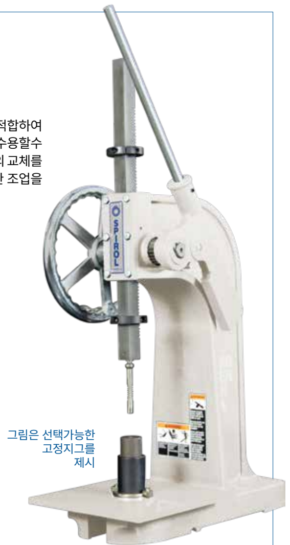
그림은 선택가능한 고정지그를 제시